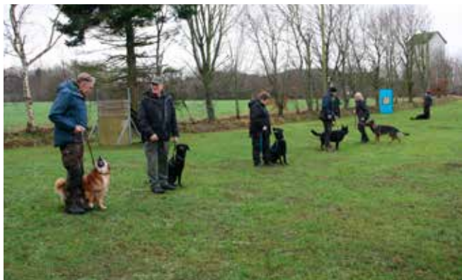
så skal vi i gang

Så vi stillede op på rækken sammen med alle de andre langbenede "hunde".