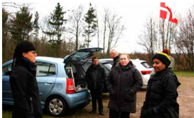
Vi mødtes på P-pladsen

Områderedaktør - Grethe Schnell ph2nyt@gmail.com