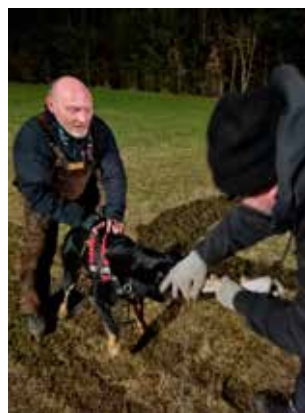
Møllers Karma til bidetræning.