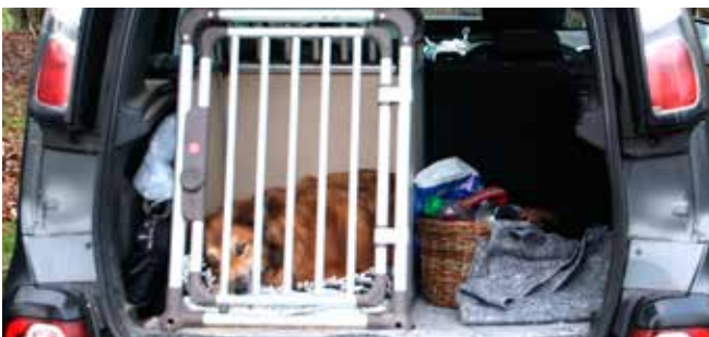
Nu blev der tid til afslapning!

Bagefter var der suppe og samvær for de 2-benede i klubhuset. På hjemvejen blev "vi" sat af i Støvringgårdskoven og så gik far og mig de sidste 4 km hjem til Mellerup.