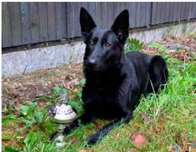
Stolt Maja med sin pokal

Vinderen af konkurrencen blev Jimmi med Delta.