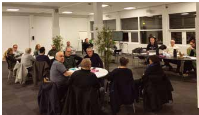
Generalforsamling i Næstvedhallernes lokaler. Der var god plads til os.

Den 26. januar blev der afholdt generalforsamling i Næstved PH. Grundet corona afholdt vi dette i det i et stort lokale i Næstved hallerne. Så der var god plads til os alle.