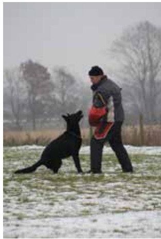
Fra dagens sidste øvelse

Jeg fik helt kuldegysninger da folk begyndte at klappe.