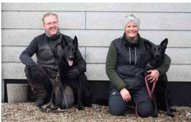
De nykårede fra Billund