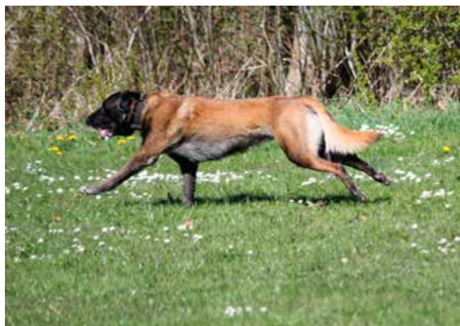
Bodhi Magic of Heroes på vej på øvelse 11 stop