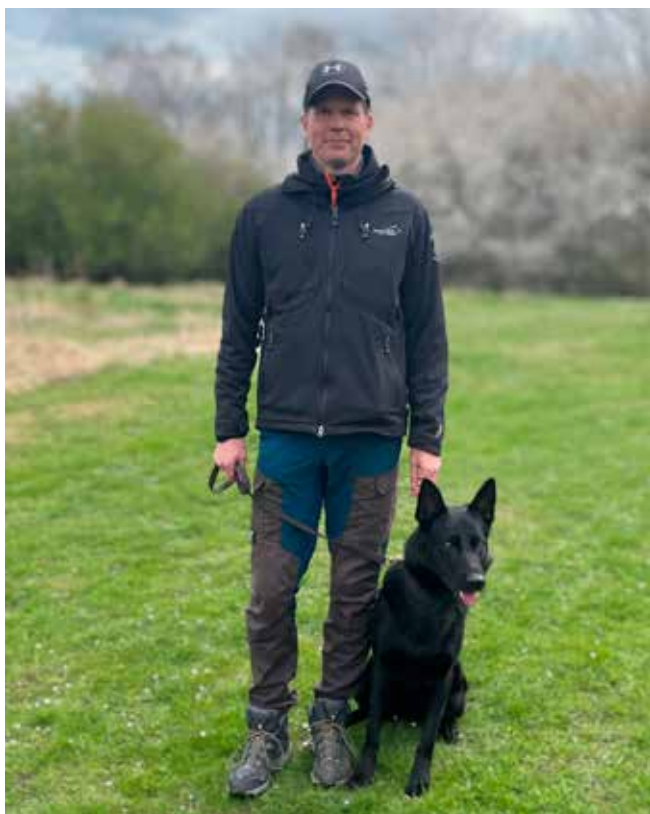
Christian og To-fast Gambler