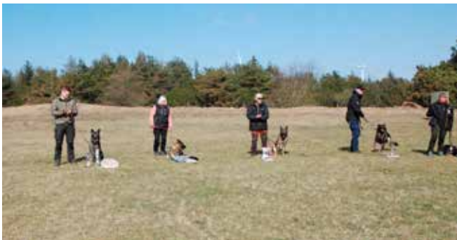
Første til femte pladsen - Tillykke.