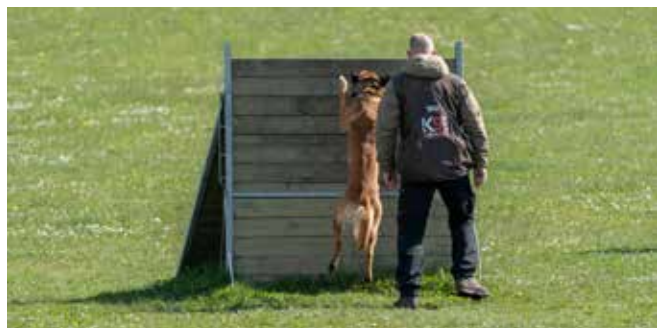
Spring så Boss