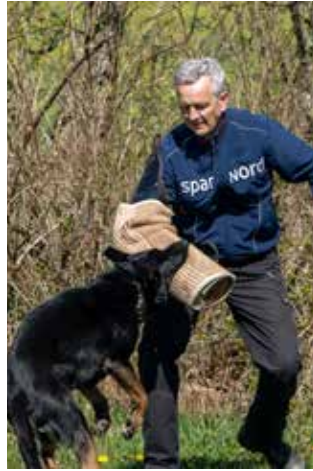
Spacey fangede også manden