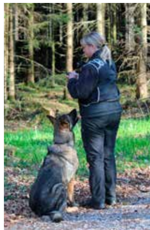
Klar til rundering

Områderedaktør - Grethe Schnell ph2nyt@gmail.com