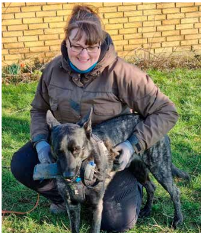
Et træningsbillede fra klubben