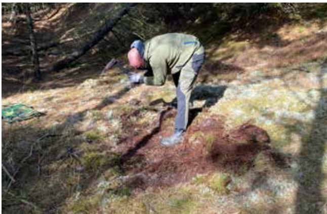
Martin graver løs, det skal jo være dybt nok