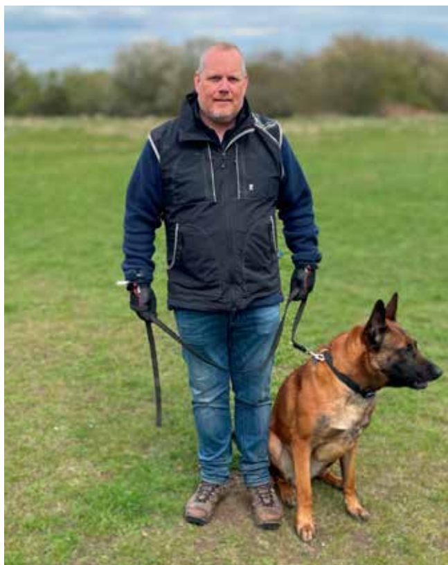
Dennis og Zerberuzdks Gangster