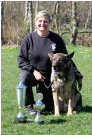
Altid dejligt også at få en pokal med hjem.

Resultaterne kom dog løbende ind og jeg kunne efterhånden se, at vi tilmed også blev nr. 1 på dagen, hvilket jo bare var skønt.