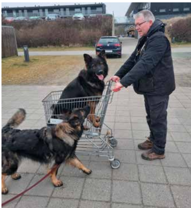
Maggie mener helt bestemt det snart må være hendes tur