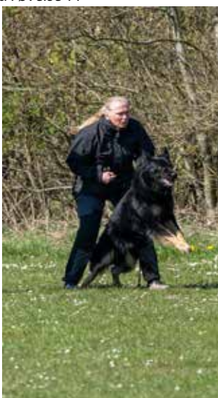
Vinder er meget klar