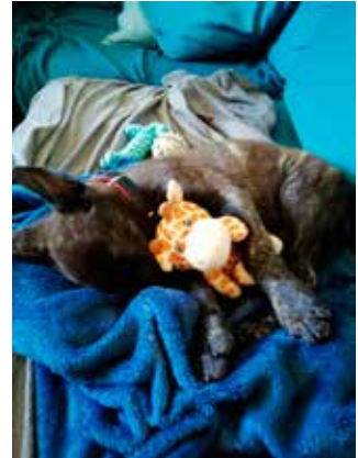
Zhadow i det nye hjem