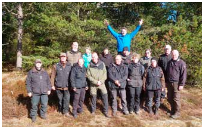
Fællesfoto af hold 2 af Ukårede/unghunde holdet