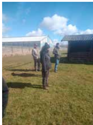
Solen skinnede og de kom- mende figuranter er klædt godt på til dagen. Ja det er ikke sommer endnu.