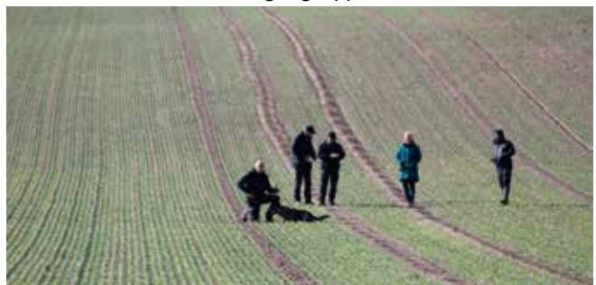
Argi har fundet den nedgravede genstand på spor