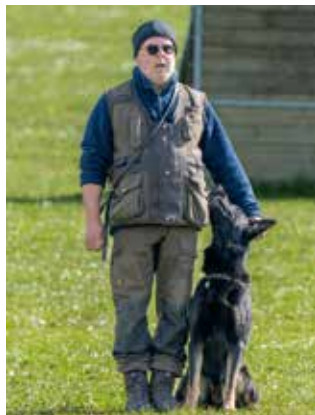
Kent og Spacey er klar