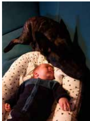
Zhadow vokser med rollen som "storebror"