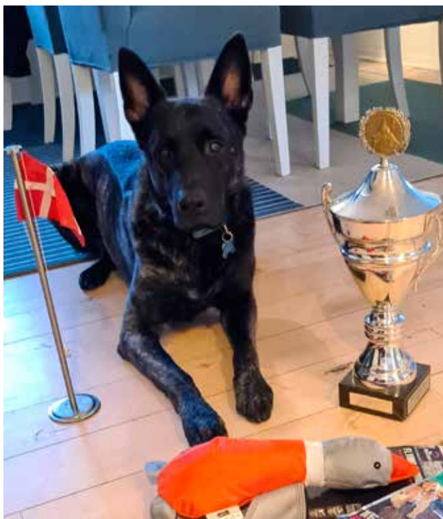
- Vores første pokal: Arets hund/hundefører