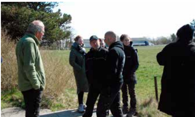
Der snakkes om dagen og ventes på resultatet