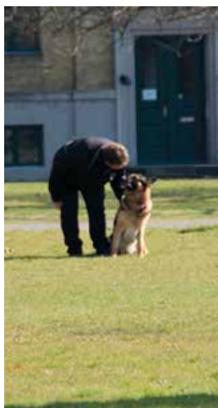
Balder instrueres i at blive liggende