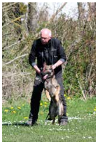
klar til stop