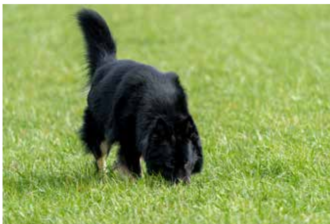
Vinder på felt

Og billeder fra dagen, som er taget af PH Hobros hoffotograf Casper Høher Uhrenholt.