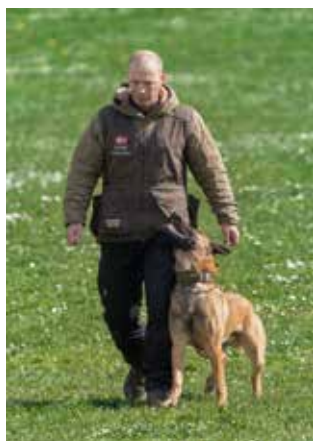
Og de tager lige fri ved fod