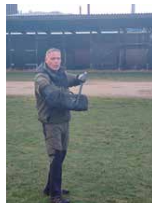
Ja hvis nogen var i tvivl om hvor hunden skal bidel