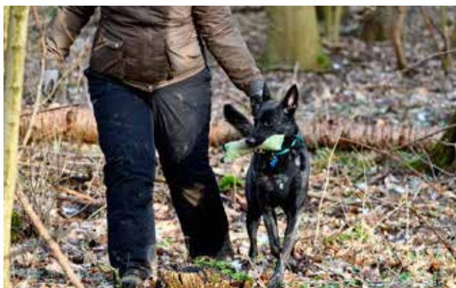
Et træningsbillede fra klubben