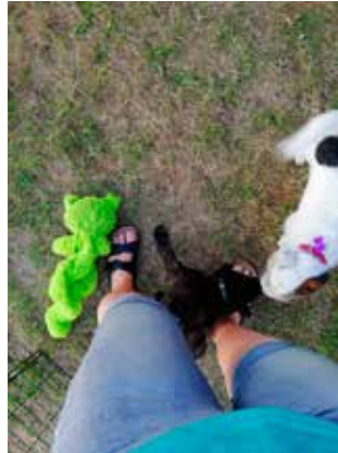
Første møde med vores Jack Russel Zoey