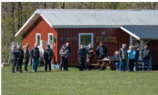
Ja der var også tilskuere