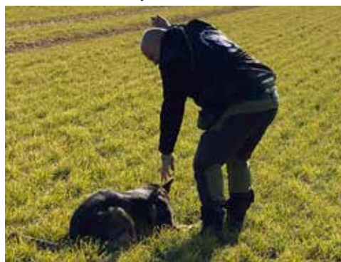
Frank til unghund 2022