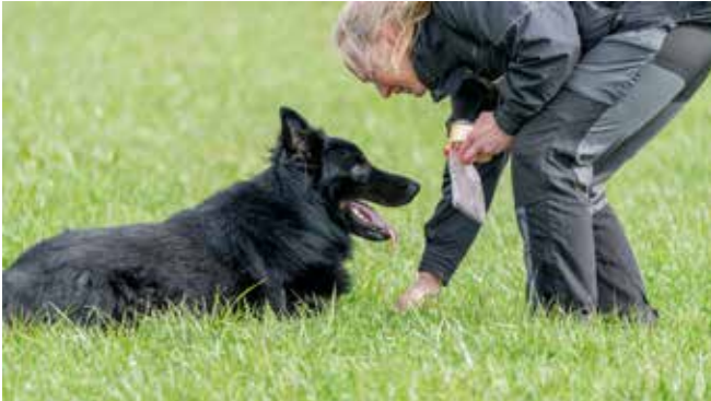
Så er der fundet noget på feltet