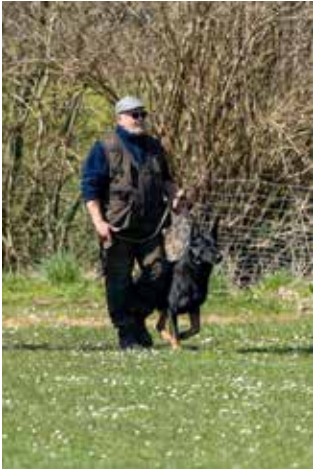
Kent og Spacey klar til øvelse 11