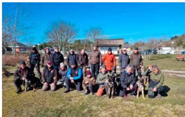
Fællesfoto af hold 1 af Ukårede/unghunde holdet

Det var en super duper dag og med alt det, vi nåede på én dag, så bliver næste års Rømø weekend bare helt forrygende.