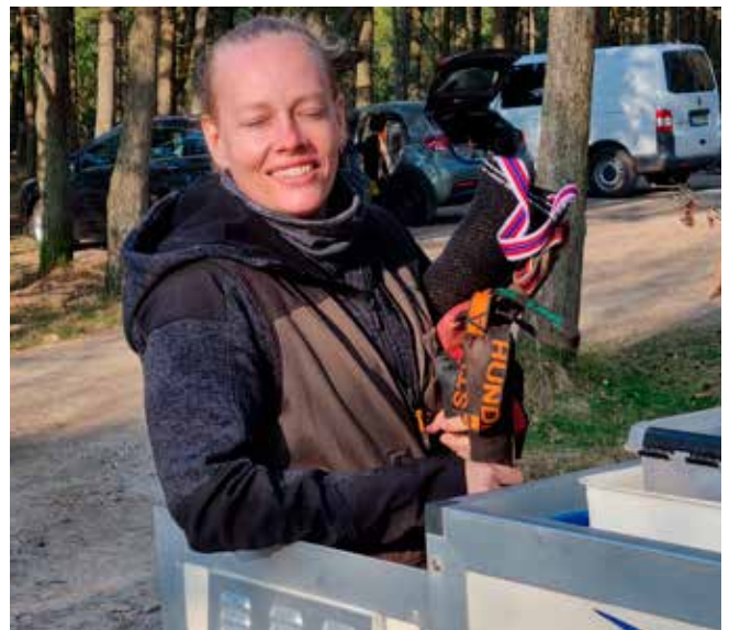
En bidepølse er åbenbart bare ikke nok for nogen