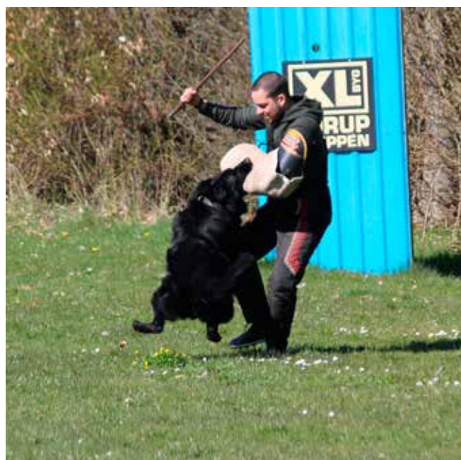
Smedebakkens Milo på øvelse 11