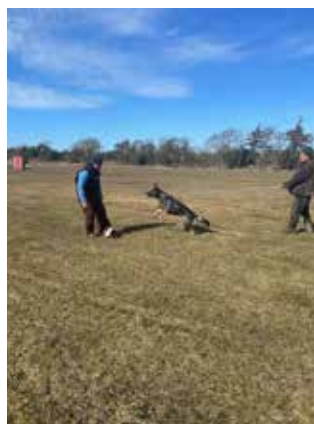
Mogens Larsen med Team Englunds Qita