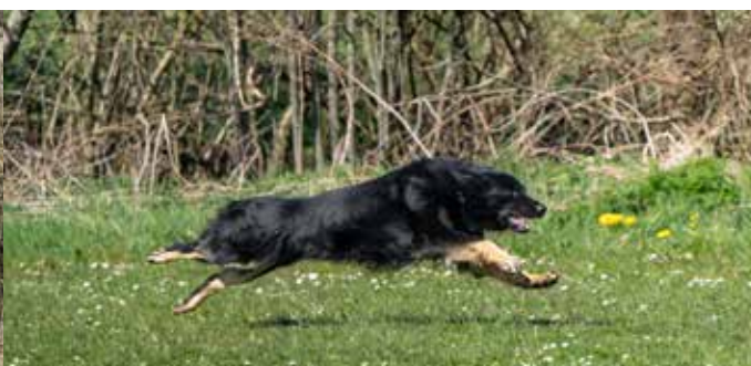
Og det skal gå stærkt