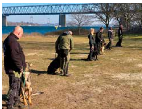
Præmieoverrækkelse unghund 2022 mph