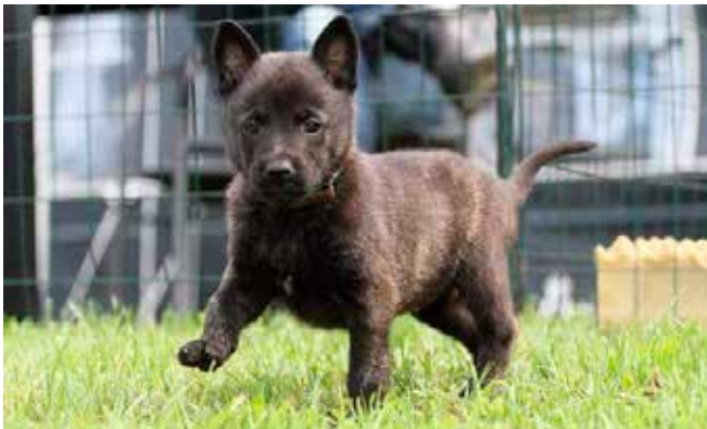
Zirius aka Zhadow

Vi har i hvert fald fået blod på tanden for at gå så langt som vi kan og nyder samarbejdet og sammenholdet vi til hver træning oplever i træning. Og så håber vi at vi kan blive ved med at overraske folk.