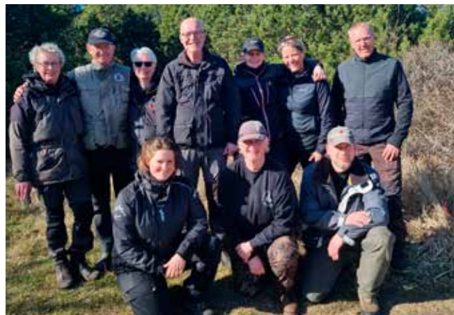
Fællesfoto af Patrulje, Kriminal, og Vinder holdet