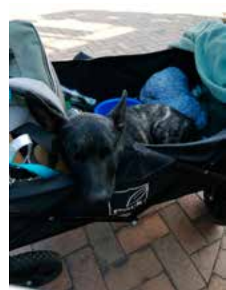
Miljøtræning i Legoland