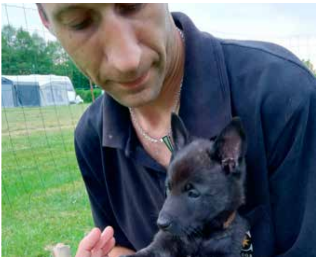
Zhadow ved et af de først besøg på i det nye campinhjem