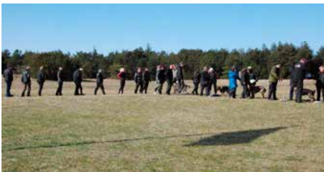
Der ønskes tillykke til hundeførerne