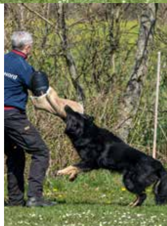
Og manden fanget