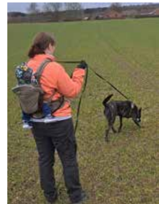
Der trænes selvfølgelig også med baby