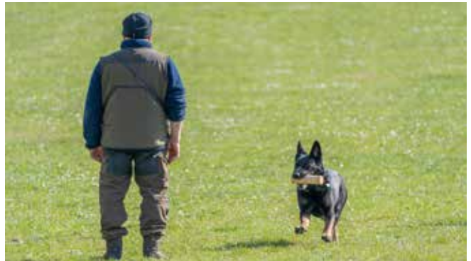
I fuld fart tilbage