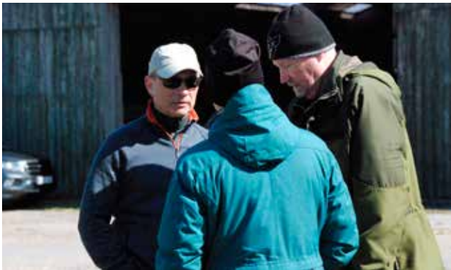
De forblæste folk fra felt og spor