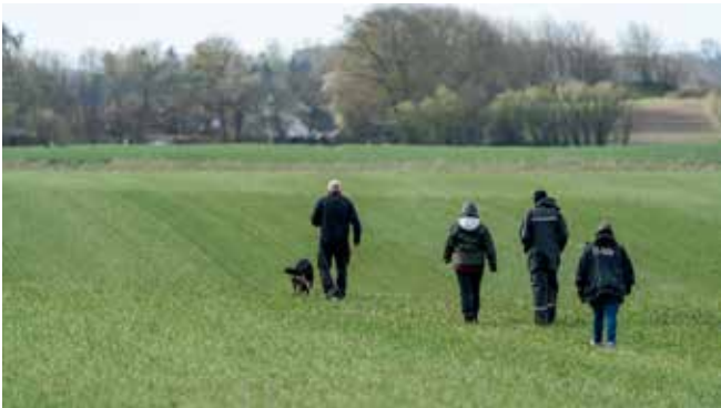
Et laaangt spor