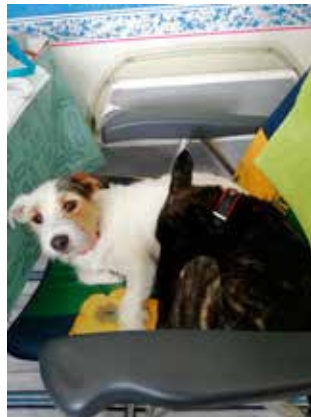
Med tiden er man blevet så gode venner at man kan deles om en stol på camping