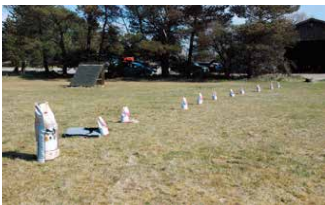
Så mangler kun hundeførerne og pokalerne - sponsorer ABC Hundeudstyr og Højmark Foder