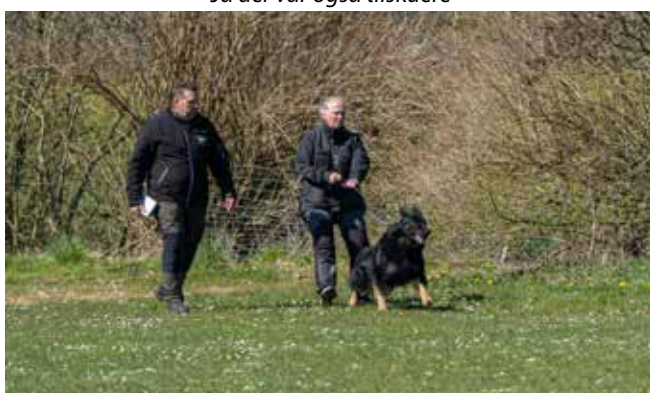
Marianne og Vinder klar til Øvelse 11