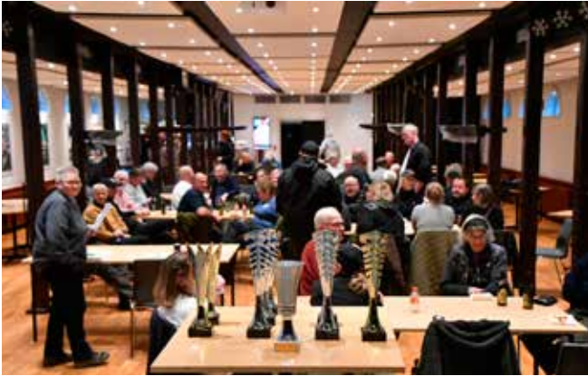
Der ventes på resultater og tales om dagens oplevelser.