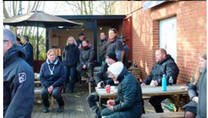
En del tilskuere havde fundet vej, godt der er plads både ude og inde