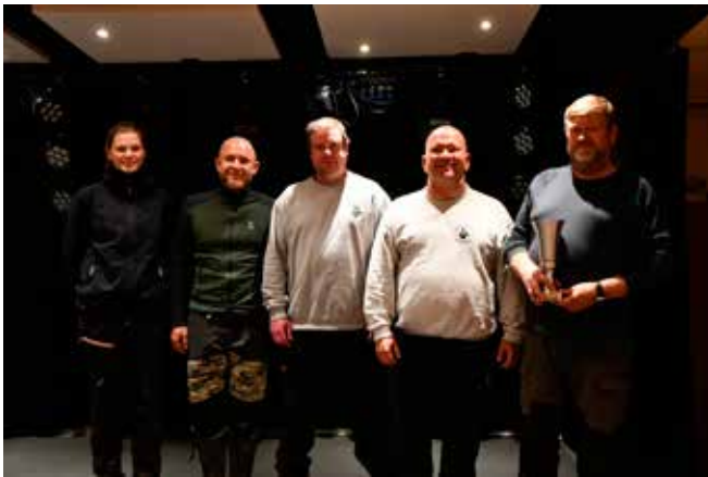
Områdemestrene 2021 Holbæk

Stort tillykke som vandt områdemesterskabet som hold og som skal holde det næste områdemesterskab.