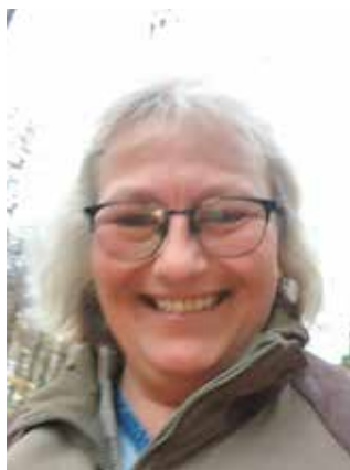
En meget glad og lidt våd figurant