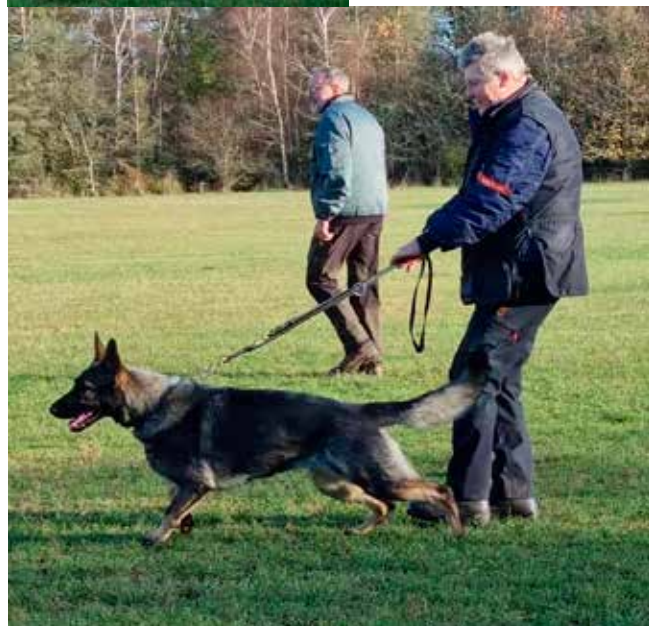
Pia opstart af stop