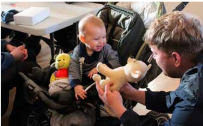
Den nye generation er på plads