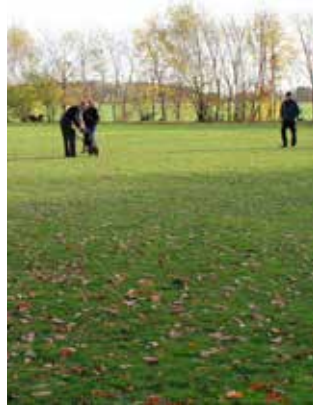
Dommerne på lydighedsbane