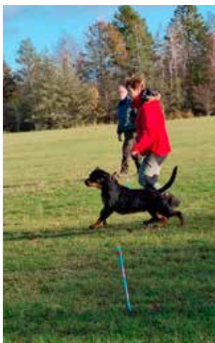
Majken opstart af stop