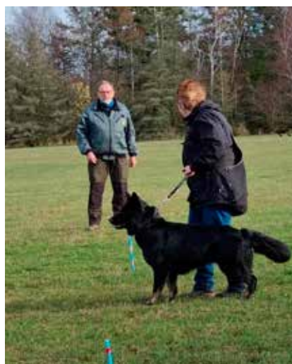
Bente opstart af stop