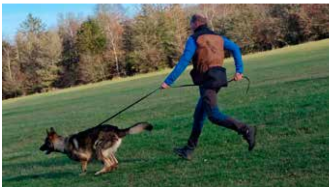
Finn opstart af stop