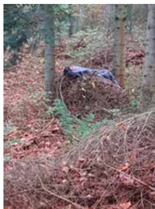
Den døde genstand på øv 9 ved unghundeopryknings konkurrencen