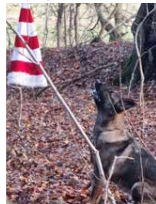
Julemandens hue blev også fundet.