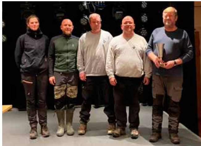
Områdemestre 2021 Holbæk afd.

Områdemesterskaberne blev afholdt den 7. november i Næstved. Vi havde deltagere i alle klasser og de gjorde et så godt arbejde at vi har vundet områdemesterskabet og skal derfor afholde det for næste år og det afholdes i april 2023.