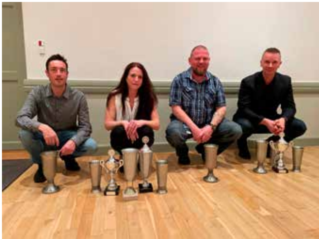
"Team Vinterhvalpehold" som fortsat træner sammen – med årets pokalhøst