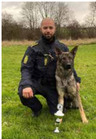
Chrifi og Fisther

Chrifi og Fisther blev i 2021 klubmestre i kåringsklassen 2021