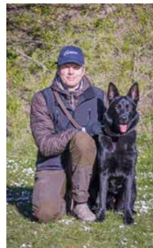
Christian og Gambler