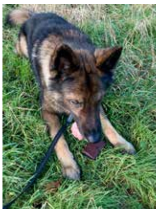
ChaDe's Aslan Karo med flot markering af den tabte pung.