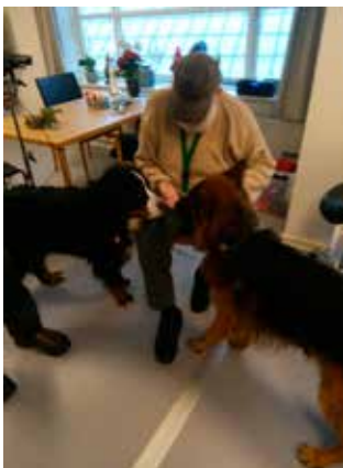
Pippi og Tito på job