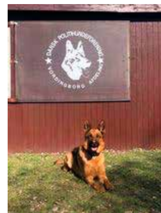
Almebo's Binne (Molly)