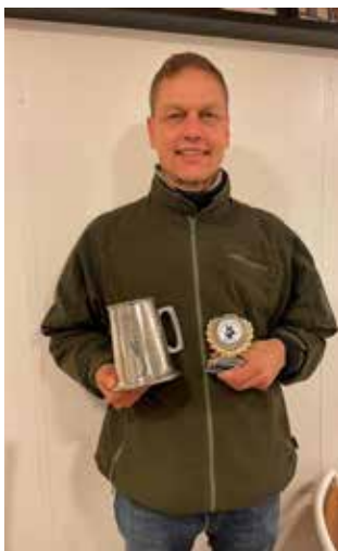
Mads og Vandrepokalen for Ung lovende hundefører

Vi ser frem til at heppe på jer til kåringen