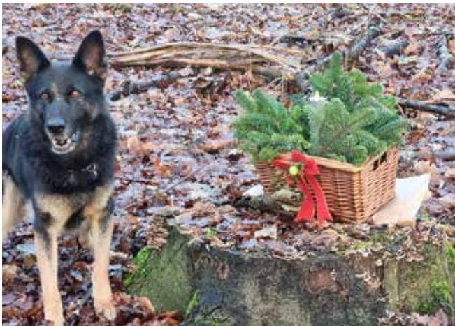
Hajen Makrel har fundet en juledekoration