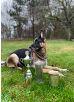
11 Amager's Qvalli