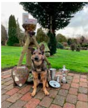
Dana von der Burg Bilstein