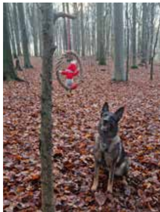
Den lille nisse blev også fundet af Korskildes A'Dajm