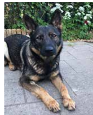
Sandtofte Aida (Indi)