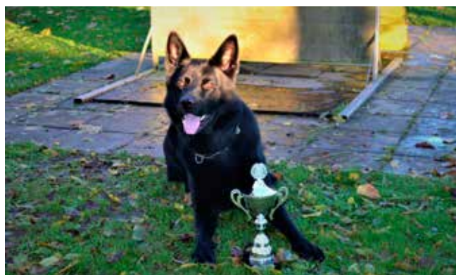
Vi-to vom Nessenberg