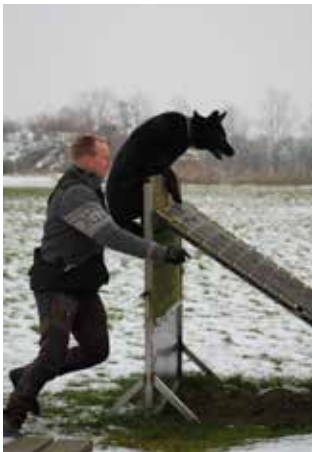
Kasper og Møllers Carma begge let på tå i øvelse 4