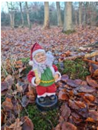
Den forfærdelige julemand med meget skinger julemelodier i, var også på banen.