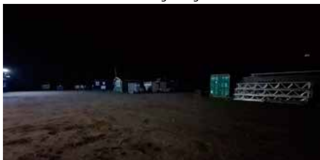
Pladsen hvor en brandstifter skulle findes