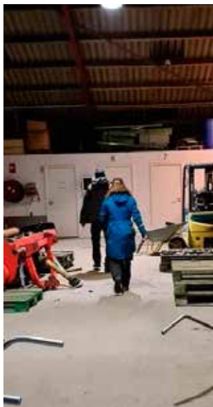
Rundering i lagerhal på Markedspladsen