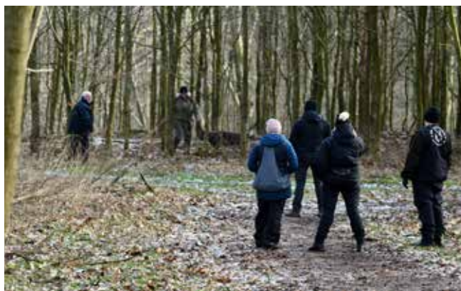
Alle følger godt med, når de forskellige hunde er på banen.