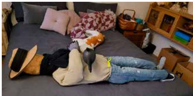
Frisk ung mand