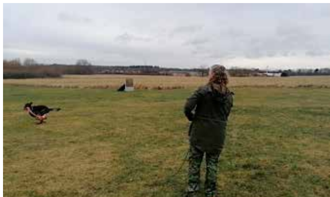
Rookie hyggede sig med tørklædet efter han har "stjålet" det

Den femte øvelse var en øvelse hvor der skulle apporteres forskellige ting. En plastrør, et pivedyr (gris, der grynter), en bold og til sidst en kyllingepølse.