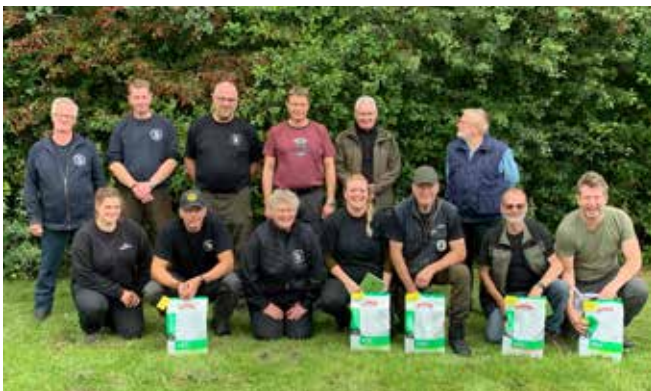
Deltager fra Område 3 til Jysk mesterskab for unghunde 2021

Sidst i september var det igen tid for årets DM, denne gang afholdt i Ringsted. Her deltog 6 ekvipager fra området samt 5 dommere og 2 figuranter.