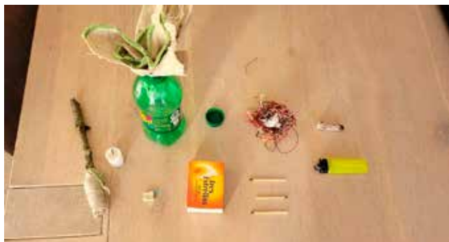
Genstande fra gerningsstedet

Lidt flere billeder fra vores natøvelse.