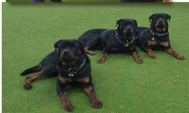
Også lige et par hunde billeder.....Dette er Jenos Uzo