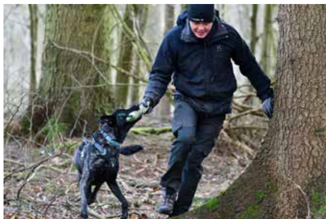
De der figuranter er nu meget sjove at finde synes Zirius i daglig tale kaldet Zhadow.