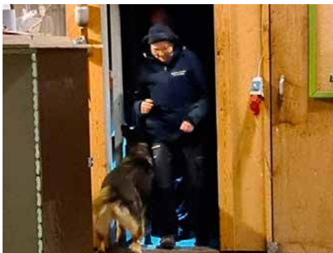
En bandit er fundet