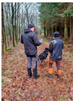
På vej ud til rundering.

Der var fin support fra Sønderborg, Tønder, Horsens, det betyder meget for hundeførere.