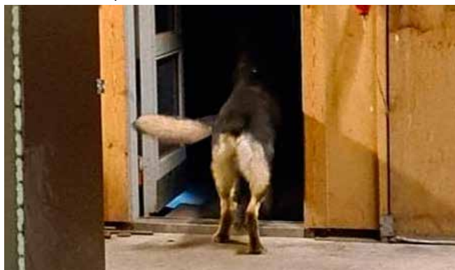
Mon der er noget herinde