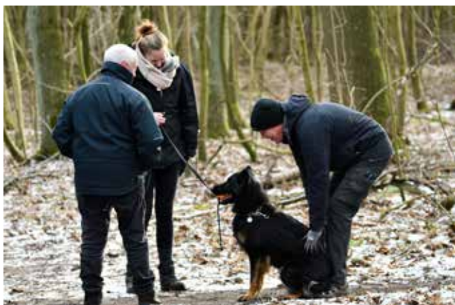
Områderedaktørens hund (Crympe Hoste) er pænt tilfreds med den opmærksomhed hun fik fra medlemmerne i Horsens.

Der blev snakket lige fra afdæknings teorier til hund/fører forhold.