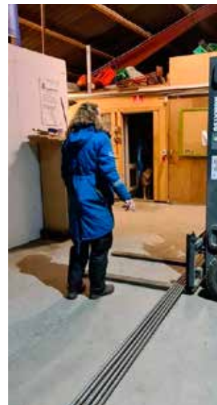
11: Et hemmelig rum