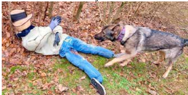
Den friske unge mand blev senere fundet skudt i benet