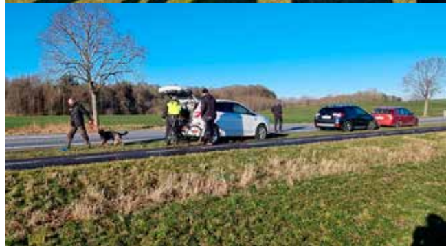
Lyal og Nirvana gør klar til spor