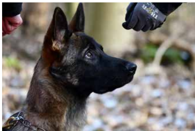
Søde Bøgilds Jas aka Wilma i fuld koncentration over godbitten i hånden